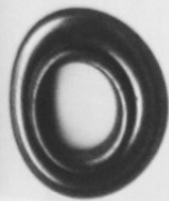
THE GROMMET STUDIO in 76